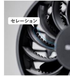
セレーションを付けたグリル