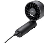
USB Type-Cに対応 (充電しながら使える)