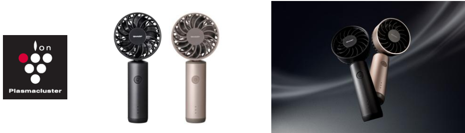
左から、プラズマクラスターオウルフローハンディファン <PJ-HS01-B（ブラック系/メタリックアッシュ）/P（ピンク系/フロストピンク）>、製品イメージ

シャープは、当社製サーキュレーターを送風構造とフクロウの翼形状の応用により、大風量とやさしい運転音を両立した、プラズマクラスターオウルフローハンディファン<PJ-HS01>を発売します。