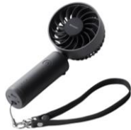
ストラップホール付き (ストラップは別売)