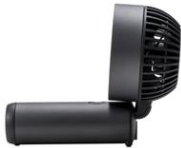
前方向に角度調整可能